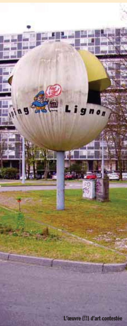
L'œuvre (!!) d'art contestée