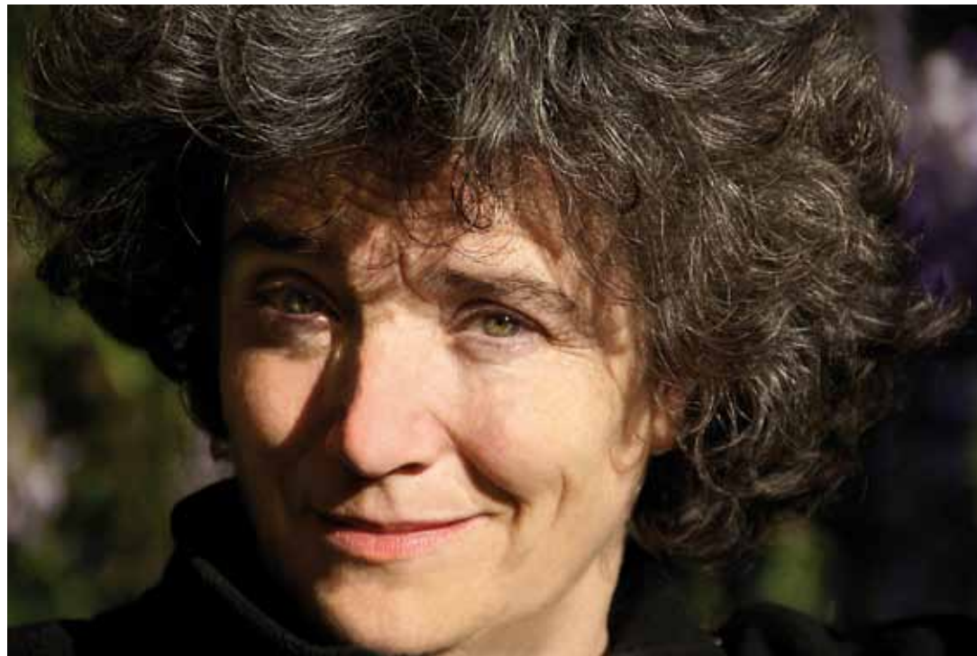
Coline Serreau, réalisatrice du film sorti en 2009

«Solutions locales pour un désordre global» Vendredi 25 mai 2012 à 19h30, au Centre protestant du Lignon 34, place du Lignon