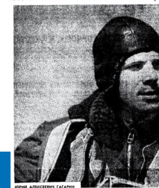
Edition de la Pravda, du 12 avril 1961

12 АПРЕЛЯ 1961 ГОДА В 10 ЧАСОВ 55 МИНУТ РОС «ВОСТОК» БЛАГОПОЛУЧНО ВЕРНУЛСЯ НА СВЯЩЕ