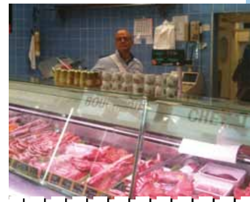
Boucherie-Charcuterie du Lignon 33, place du Lignon • 022 796 43 40