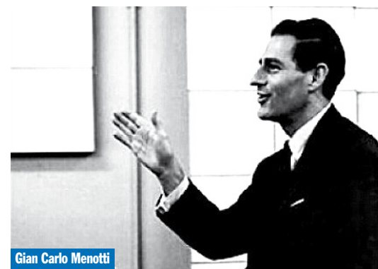
Gian Carlo Menotti