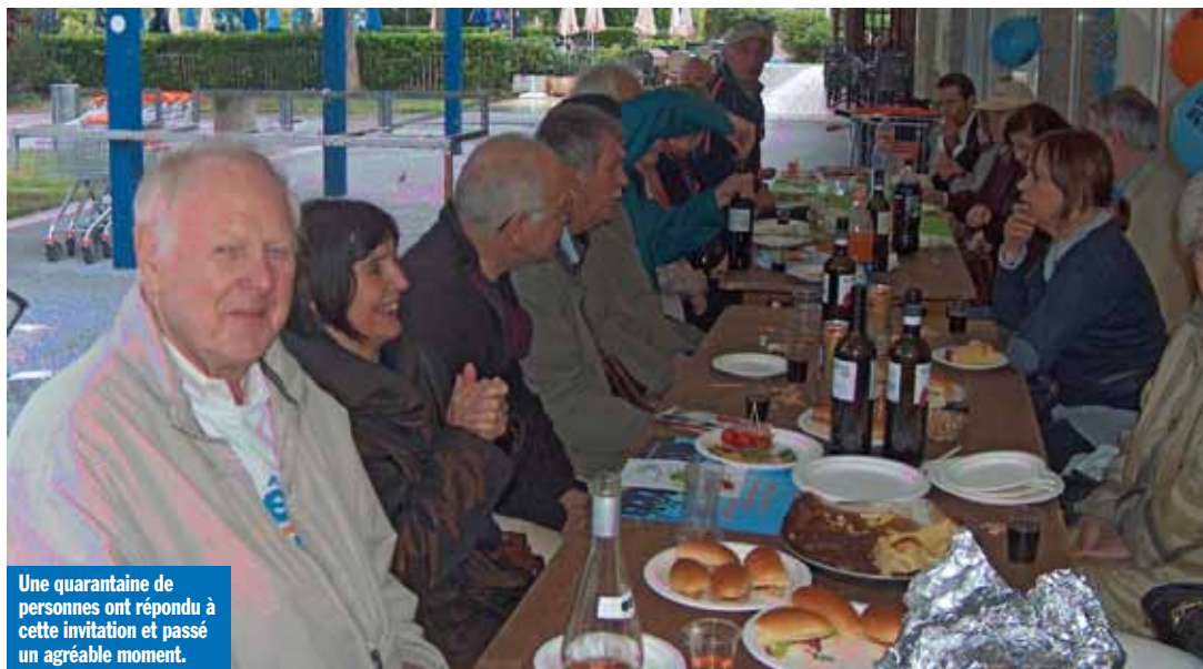
Une quarantaine de personnes ont répondu à cette invitation et passé un agréable moment.

Objectif atteint pour le Contrat de quartier et bravo et merci aux organisateurs et aux habitant-e-s qui ont participé.