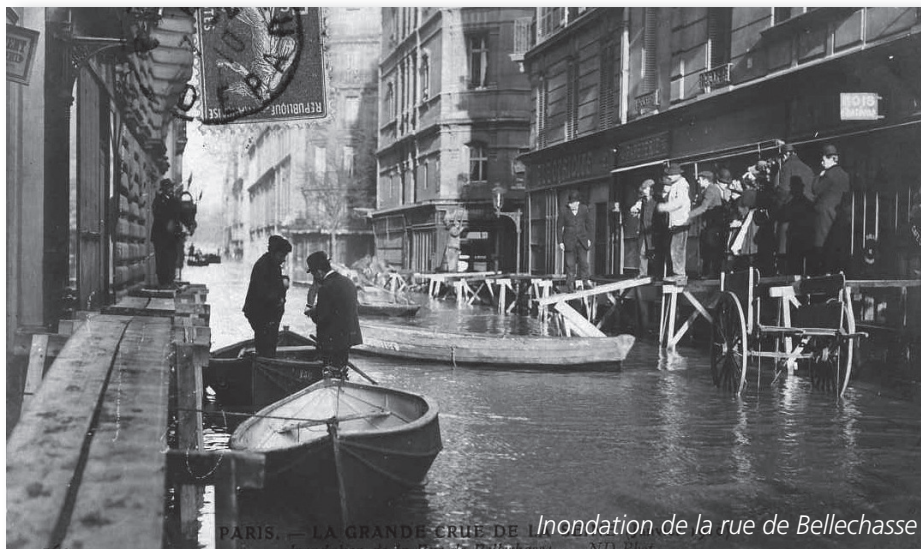
PARIS. — LA GRANDE CRUE DE LA SEINE. — Inondation de la rue de Bellechasse. — N11. Plat.

Le 20 janvier la navigation sur la Seine est interrompue. Le vendredi 21 janvier (jour de la naissance de la centenaire du Lignon) l'usine d'air comprimé est noyée. Le 22 janvier le métro est envahi par les eaux. Le 23 janvier les caves du Palais Bourbon sont inondées et le 24 janvier la cote atteint 7 mètres 65. Le niveau maximum de 8 mètres 62 est atteint le 28 janvier