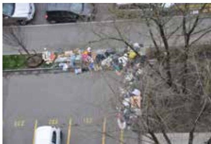
Photo prise le 6 février 2018 – Avenue du Lignon

Ramassage des encombrants et de la ferraille : mardi 10 avril 2018. Merci de respecter ces horaires et ne pas transformer nos rues en déchetterie !