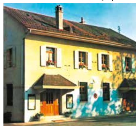
La Mairie jusqu'en 1973

Le 16 février 1917, décès, à Paris, à l'âge de 69 ans, d'Octave Mirbeau , journaliste, critique d'art, romancier et dramaturge français. Né le 16 février 1848 à Trévières (Calvados), il est fils de médecin et passe son enfance à Rémalard (Orne), dans un milieu compressif propice à la névrose, où il situera d'ailleurs ses premiers romans. Après des études chez les jésuites de Vannes, d'où il est chassé, il travaille chez un notaire, puis participe, en 1870, comme mobile de l'Orne, à la débâcle des armées de la Loire, possédant déjà une plume remarquable et un humour dévastateur, tournant en dérision les «mystifications» politiques, religieuses et patriotiques. L'une de ses œuvres les plus connues, après «Le Calvaire» (1886), est «Le journal d'une femme de chambre» (1900) qui fait découvrir, à travers la soubrette, Célestine, les nauséabonds «dessous» de la société bourgeoise et qui verra la réalisation d'adaptations cinématographiques, notamment en 1964 par Luis Bunuel avec Jeanne Moreau et Michel Piccoli et la dernière, en 2015, par Benoît Jacquot avec Léa Seydoux et Vincent Lindon